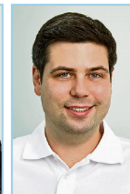
ZA Antreas Karajan Parodontologie, Prothetik